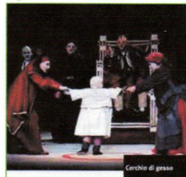
Figura 1. Scena teatrale

"Il cerchio di gesso del Caucaso" è un'opera teatrale di B. Brecht del 1944-45, trasposizione di un'antica leggenda orientale incentrata sull'amore genitoriale e sulla saggezza e sagacia del verdetto di un giudice, chiamato a riconoscere la vera madre di un figlio conteso (Figura 1). Il riferimento artistico-letterario ben si presta a introdurre la problematica sottesa alla cosiddetta "Sindrome di Alienazione Parentale" o PAS, codificata nel 1985 da R. Gardner, psichiatra forense alla Columbia University , e da allora più croce che delizia di famiglie, tribunali, psicologi e società civile.