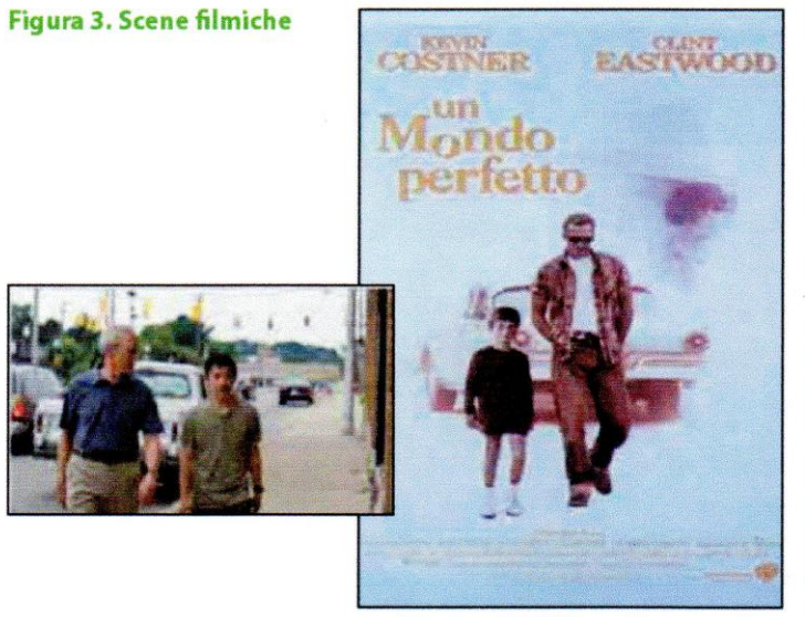
Figura 3. Scene filmiche

Sarebbe consigliabile l'utilizzo ottimizzato della prassi dell'"home-visiting", che può essere di grande aiuto nelle fasi del disagio e della crisi prelimina-