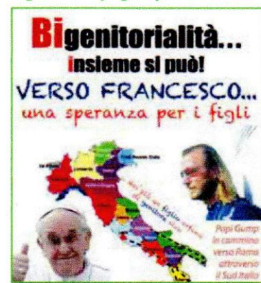
Figura 4. Papi-gump in cammino

nizzazioni sovranazionali (UNICEF, UNESCO, Banca Mondiale, Save the Children), soggetti istituzionali (Garante dell'Infanzia, Osservatorio dell'Infanzia e Adolescenza), associazioni di volontariato paragonative o non governative più o meno note, come Caritas, Colibrì, Telefono Azzurro, Telefono Arcobaleno e - "last but not least" - Papi-gump, recentemente scesa in campo per la tutela appassionata della bi-genitorialità e dei diritti dei padri ex-coniugi, passati attraverso l'esperienza devastante vissuta tra alienazione, tribunali ed esiti processuali e oggi "più grigi ma non domi", come canta (il poeta) Claudio Baglioni, in difesa di principi e diritti comuni (Figura 4). Tale finalità può anche assumere, ben al di là delle vicende personali e generali di rifrazione paterna di "vulnus" alienatorio, una valenza di ricerca simbolica e di recupero di quelle radici psicologiche, antropologiche e culturali in grado di ricondensare e riempire di senso quella figura di padre la cui idea, secondo la formulazione di J. Lacan, si è come evaporata col venir meno della funzione orientativa dell'Ideale nella vita individuale e collettiva dell'ultimo secolo, mentre secondo altri (e molto più prosaicamente) è stata appannata e snaturata dal proliferare incontrollato di separazioni e divorzi, generando comunque quella che le scienze sociali definiscono una "società senza padri".